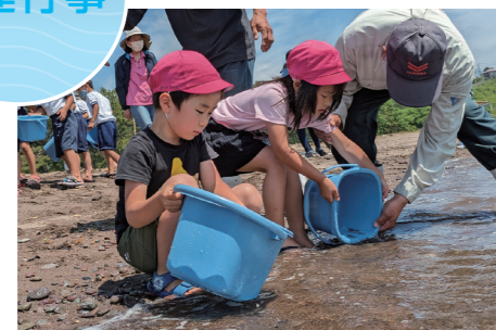
大会関連リレー放流