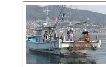
マコガレイ生息域の海底耕うん

左記の各部門の「豊かな海づくり」の活動に永年にわたって貢献し、その功績が顕著であった団体等に対し、大会会長賞、農林水産大臣賞、環境大臣賞、水産庁長官賞を授与し、全国豊かな海づくり大会式典で表彰を行ってきました。