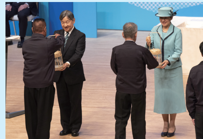
稚魚等のお手渡し