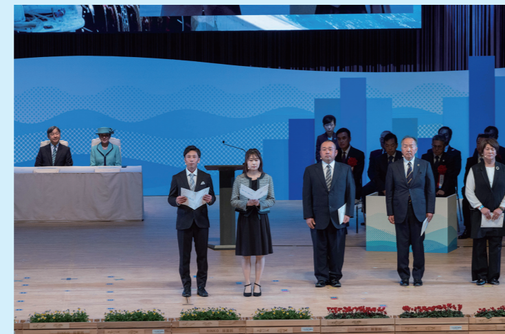
海づくりメッセージ