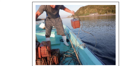
抱卵コケの再放流