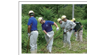
植樹山林での下草刈り作業