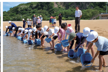
大会関連リレー放流